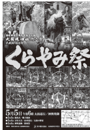
ぜひ、お買い求めください

▽問合せ 経済観光課観光係(335・4095)、または観光情報室(302・2000)