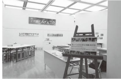
▲昨年度のアートスタジオ展の様子

対象は当館アートスタジオで制作した作品/無料/内容は4月29日(祝)から5月6日(火)に市民ギャラリーで開催する「アートスタジオ展」での展示/搬入・搬出は各自で行ってください/申込みは4月19日(土)までに直接当館へ