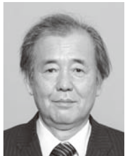
宮町 358・8100 / 63歳