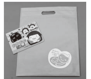
▲ぜひ、ご活用ください